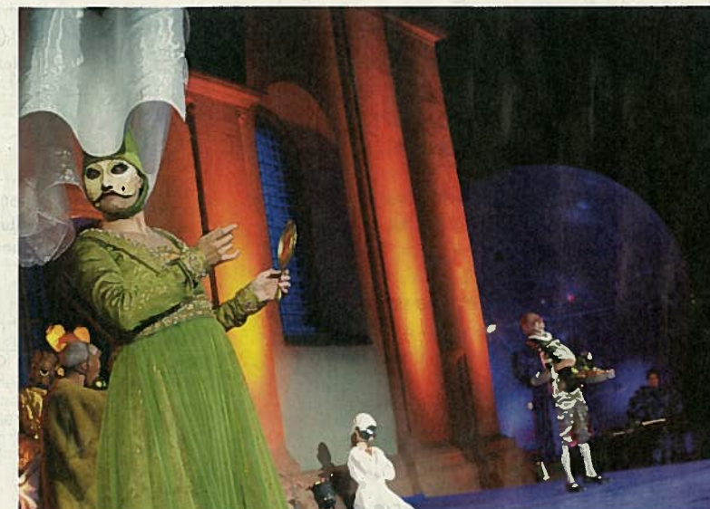
Der Blick in den Spiegel: Was sehen wir – außer Masken und Kleiderbündeln?