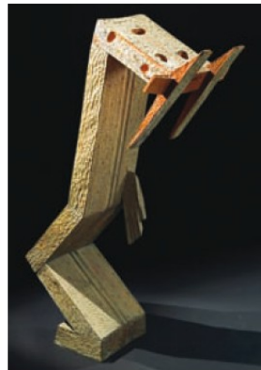
Gewandelter Stil 50 Jahre nach dem „Schalk“: „Christus fällt“.

Kraft und den Witz besessen, sich als „Schalk“ darzustellen. Später zeigten die Selbstportraits dann einen Menschen, dessen Physiognomie in einem rechteckigen Block steckt. In ähnlicher Weise