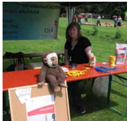
Stationenspielstand auf der Zelttheaterwoche.

Im Rahmen der Zelttheaterwoche der Stadtjugendarbeit Bad Kissingen, die in der zweiten Pfingstferienwoche im Luitpoldpark stattfand, hat die Regionalstelle für alle interessierten Kinder eine Schatzsuche angeboten. An zwei Tagen (23. und 24.06.2011) konnten die Kinder an Stationen Aufgaben meistern, und bekamen für jede erledigte Aufgabe jeweils ein Puzzle-Teil einer Schatzkarte. Nachdem sie alle Puzzle-Teile zusammen hatten, konnten sie einen Schatz finden. Rund 320 Kinder beteiligten sich an der Schatzsuche.