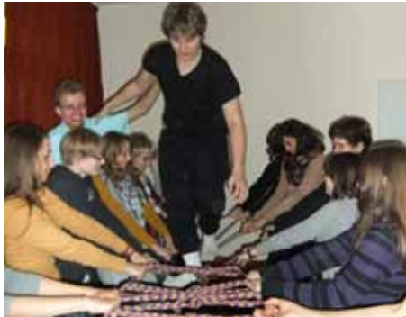
Jugendlicher auf der Seilbrücke.

Ein stärkendes Wochenende für jugendliche Firmlinge