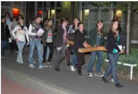
Jugendliche tragen das Kreuz