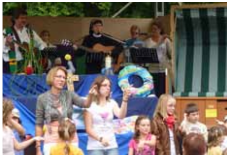
Mit Gott im Strandkorb!