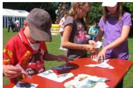
Am Ende mussten die Puzzleteile der Schatzkarte zusammengefügt werden.

Im Rahmen der Zelttheaterwoche der Stadtjugendarbeit Bad Kissingen, die in der zweiten Pfingstferienwoche im Luitpoldpark stattfand, hat die Regionalstelle für alle interessierten Kinder eine Schatzsuche angeboten. An zwei Tagen (23. und 24.06.2011) konnten die Kinder an Stationen Aufgaben meistern, und bekamen für jede erledigte Aufgabe jeweils ein Puzzle-Teil einer Schatzkarte. Nachdem sie alle Puzzle-Teile zusammen hatten, konnten sie einen Schatz finden. Rund 320 Kinder beteiligten sich an der Schatzsuche.