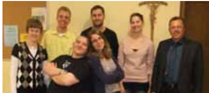
BDKJ Vorstand Bad Kissingen 2011

Der Bund der Deutschen Katholischen Jugend (BDKJ) ist der Dachverband der katholischen Jugendverbände. In ihm haben sich die kirchlichen Jugendverbände zusammengeschlossen um die kirchliche Jugendarbeit in Politik, Kirche und Gesellschaft zu vertreten. So übernimmt der BDKJ Vertretungsaufgaben im Dekanatsrat und im Kreisjugendring. Darüber hinaus beteiligte er sich am ökumenischen Jugendkreuzweg und bot eine Fahrgelegenheit zur Kiliani – Jugendwallfahrt nach Würzburg an. Am Ende des Schuljahres veranstaltete der BDKJ zusammen mit der Regionalstelle einen „Ehrenamtsdanke-schön“ für die Gruppenleiter und Oberministranten. Alle Ehrenamtliche in der Region waren zu einem Grillabend eingeladen.