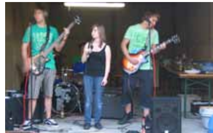
„Brain for Breakfast“, die Überraschungsband aus dem Altlandkreis Bad Brückenau

Viele Jugendgruppenleiter und Ministranten waren unserer Einladung am 06.07.2012 in den romantischen Pfarrgarten nach Langendorf gefolgt. BDKJ und Regionalstelle haben sich mit dem „Ehrenamts-Dankeschön-Grillen“ mit reichlich Steaks, Bratwürsten, Salatbuffet und Live-Musik mit der Band „Brain for Breakfast“ für das große Engagement bedanken. Die Stimmung war super und geschmeckt hat's auch allen!