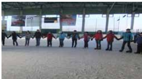
BDKJ on ICE in der Eishalle Bad Kissingen Jan. 11

Der Bund der Deutschen Katholischen Jugend (BDKJ) ist der Dachverband der katholischen Jugendverbände. In ihm haben sich die kirchlichen Jugendverbände zusammengeschlossen um die kirchliche Jugendarbeit in Politik, Kirche und Gesellschaft zu vertreten. So übernimmt der BDKJ Vertretungsaufgaben im Dekanatsrat und im Kreisjugendring. Darüber hinaus beteiligte er sich am ökumenischen Jugendkreuzweg und bot eine Fahrgelegenheit zur Kiliani – Jugendwallfahrt nach Würzburg an. Am Ende des Schuljahres veranstaltete der BDKJ zusammen mit der Regionalstelle einen „Ehrenamtsdanke-schön“ für die Gruppenleiter und Oberministranten. Alle Ehrenamtliche in der Region waren zu einem Grillabend eingeladen.