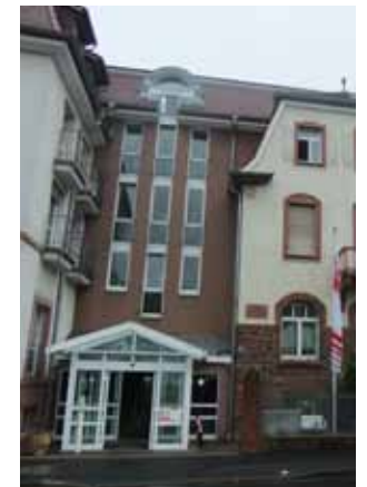
Die Regio ist im ersten Stock rechts im Caritas- Altenheim St. Gertrudis gegenüber des Theaterparkhauses.

Wir sind zu finden im Haus Gertrudis, Kapellenstraße 9, im ersten Stock auf der rechten Seite.