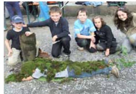
Im Hüttendorf am Farnsberg