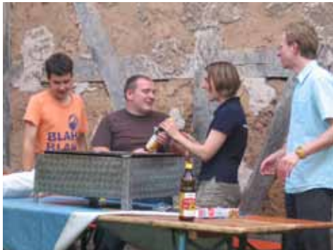
Am Grill beim Ehrenamtsdankeschön