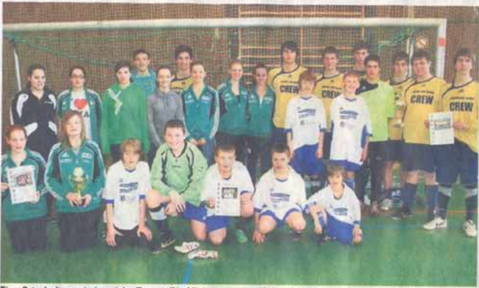
Eine Ortschaft, zwei siegreiche Teams: Die Ministranten aus Schönderling gewannen bei den Dekanatsmeisterschaften sowohl den Wettbewerb der Buben-Mannschaften bis 15 Jahre als auch den der Mädchen-Teams.

Bad Brückenau – Einen doppelten Erfolg feierten die Schönderlinger Ministranten bei den Dekanatsmeisterschaften im Sportzentrum Römershag. Die Mannschaft der Buben ab 15 Jahre siegte ebenso wie die das Mädchen-Team. Schönderling Buben durften sich über Platz eins im Wettbewerb der Mannschaften bis 14 Jahre freuen.