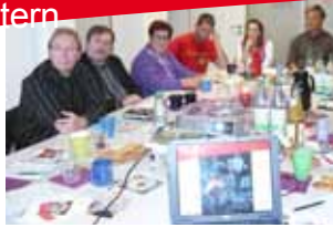
Präsentation beim Just in KG

04 | Zusammenarbeit mit pastoralen Mitarbeitern