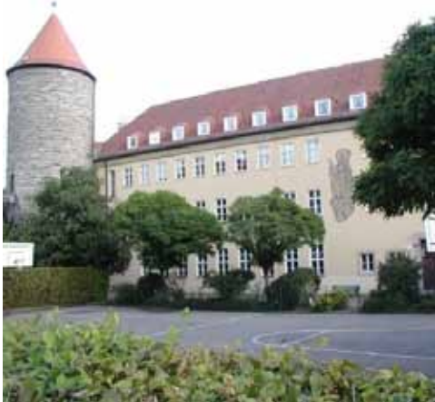
Jugendhaus am Dicken Turm in Münnerstadt.