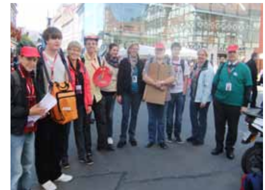
Die TeilnehmerInnen bei der Papstfahrt 2011

Nach der Begegnung mit dem Papst war ein kleiner Stadtbummel angesagt, bevor es wieder Richtung Heimat ging. O-Ton: „Es war eine Feier, die mich im Glauben gestärkt hat!“