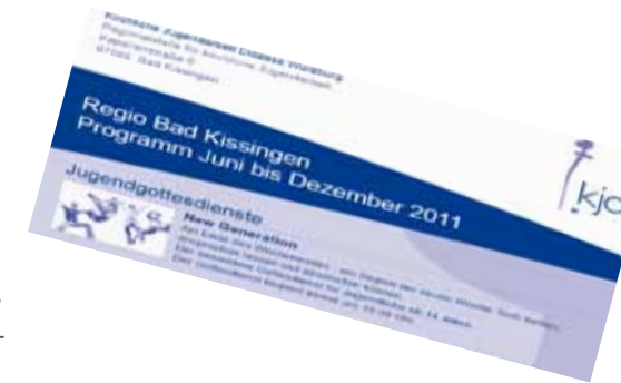
Jahresprogramm im neuen Design

Neu: Die Regio Kissingen auf Facebook: Seit dem 01.03.2011 ist die Regio auch auf Facebook vertreten. Veranstaltungen werden vorgestellt und wie es in einem Netzwerk so zugeht kann man miteinander Nachrichten schreiben und in Kontakt bleiben. Wir freuen uns aber vor allem über lebendige Besucher mit denen man sich ‚face to face‘ unterhalten kann!