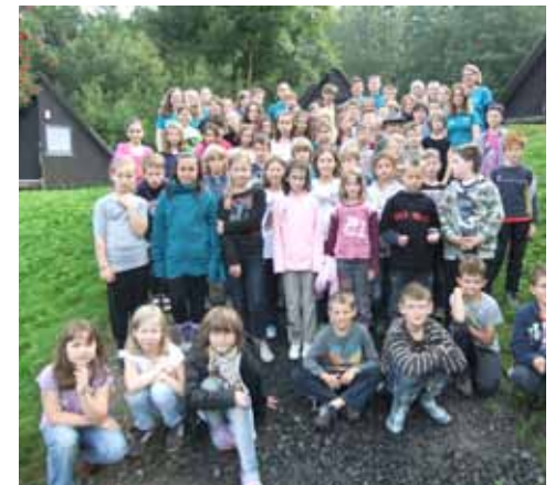
Die Kinder und Betreuer auf dem Farnsberg 2011