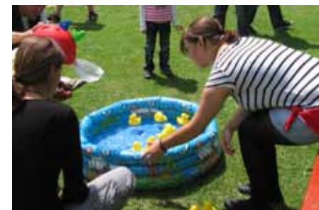
Mit einem Helm musste man Enten aus dem Planschbecken fischern.