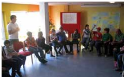
Stuhlkreis bei den Kennenlertagen

Auch in diesem Jahr konnten wir wieder – mit Unterstützung der Tutoren – vom 28. - 30.9. und vom 05. - 07.10.2011 die Kennenlertage für die drei fünften Klassen der Realschule Bad Brückenau durchführen. Viel Spaß hatten die Kids vor allem bei den vielen Kooperationsübungen und Kennenlernspielen.