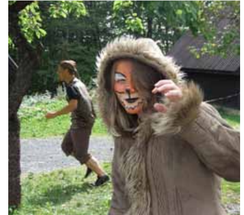
Löwen waren bei der Safaritour auch dabei.