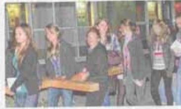
Tragen gemeinsam das schwere Kreuz: Rund 60 Jugendliche nahmen am Ostermischen Kruzweg der Jugend teil.

BAD KISSINGEN (vl) Sie sind schnell und zielgerichtet, die beiden Konfessionen, die die 14 Stationen des Kreuzwegs verbinden, sind ein Projekt der beiden Konfessionen in Bad Kissingen. Die 14 Stationen des Kreuzwegs sind ein Projekt der beiden Konfessionen in Bad Kissingen.