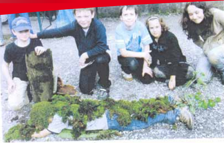
Der Jugendkruzweg hat einen ökologischen Fußabdruck.