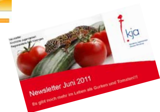
Newsletter im neuen Design

Das Jahresprogramm kommt jetzt immer zwei Mal jährlich heraus und schafft mit seinem neuen Design Überblick und eine Kurzinformation über die Veranstaltungen. Zusätzlich werden dann noch Flyer mit genaueren Informationen der einzelnen Veranstaltungen verteilt.