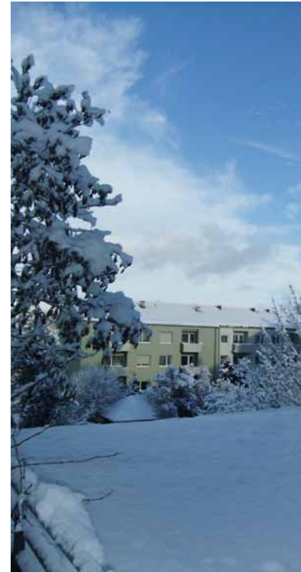
Blick aus der Regio im Winter.